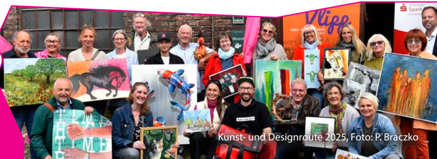
Kunst- und Designroute 2025